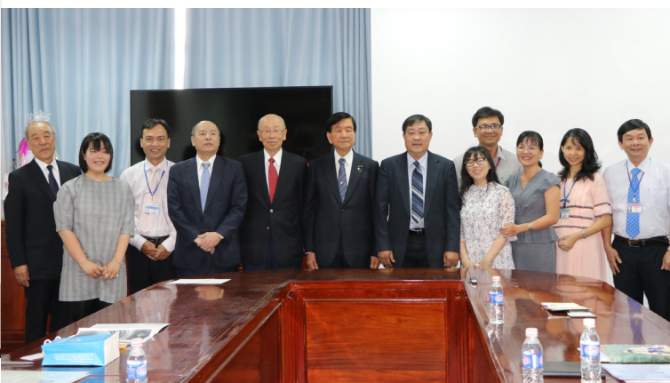
Ảnh lưu niệm.

Tại buổi làm việc, hai bên đã trao đổi thông tin, thảo luận và đi đến thống nhất một số nội dung, vạch ra những định hướng hợp tác giữa các trường đại học của hai bên trong thời gian tới, tạo bước khởi đầu cho mối liên kết chặt chẽ, bền vững giữa các trường đại học nói riêng và mối quan hệ tốt đẹp giữa Việt Nam và Nhật Bản và nói chung.