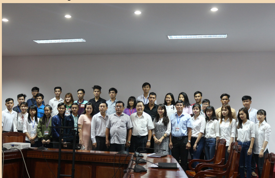
Ảnh lưu niệm.

Trong không khí gặp mặt đầm ấm và nhiều ý nghĩa, đại diện các em sinh viên đã gửi lời cảm ơn chân thành đến Ban Dân tộc tỉnh Cà Mau và Trường ĐHCT đã hỗ trợ cho các em trong suốt 4 năm học tập tại Trường; giúp các em hoàn thành tốt quá trình học tập của mình và vững tin hơn trên bước đường tương lai. Qua đó, các em sinh viên cũng hứa là sẽ cố gắng học tập thật tốt để không phụ lòng mong mỏi và sự quan tâm của gia đình và xã hội.