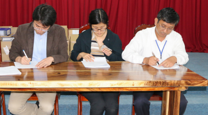
Tham gia mở thầu cùng đại diện các nhà thầu kỹ biên bản mở Hồ sơ đề