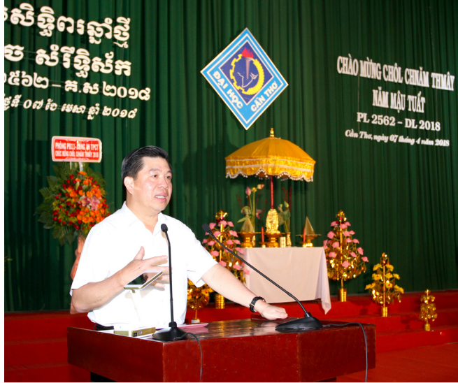
Ông Lê Sơn Hải, Phó Chủ nhiệm Ủy ban Dân tộc Chính phủ phát biểu tại buổi Họp mặt.

Trường ưu tiên xét duyệt, sắp xếp chỗ ở giúp các em tiết kiệm chi phí, an tâm học tập, sinh hoạt và rèn luyện. Bên cạnh đó, Nhà trường huy động mọi nguồn lực để thực hiện nhiệm vụ đào tạo sinh viên là người dân tộc đóng góp cho việc cung cấp và phát triển nguồn nhân lực cho các tỉnh ĐBSCL, đặc biệt là các tỉnh có nhiều người dân tộc sinh sống.