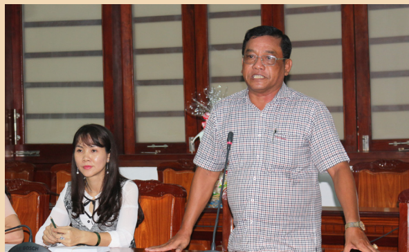
Đại diện Ban Dân tộc tỉnh Cà Mau chúc Tết và chia sẻ thông tin.

Phát biểu tại buổi họp mặt, GS.TS. Hà Thanh Toàn, Hiệu trưởng Trường ĐHCT cho biết, tổng số sinh viên chính quy đang học tại Trường là khoảng 31.500 sinh viên. Sinh viên người dân tộc thiểu số hơn 2.800, trong đó người dân tộc Khmer khoảng 1.682 sinh viên. Khoảng 2.795 sinh viên quê ở Cà Mau đang học tại Trường ĐHCT, trong đó có 45 em sinh viên là người dân tộc Khmer. Nhà trường luôn quan tâm và dành nhiều chính sách hỗ trợ, ưu tiên cho các em sinh viên người dân tộc Khmer khi tham gia học tập và rèn luyện tại Trường. Tết cổ truyền Chôl Chnăm Thmây đang cận kề, Hiệu trưởng cũng gửi những lời chúc mừng tốt đẹp nhất đến đồng bào dân tộc Khmer, chúc mọi người có một cái Tết thật vui tươi và hạnh phúc.