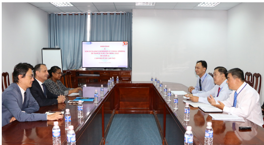
Buổi tiếp Tổng Lãnh sự Pháp tại Nhà Điều hành, Trường ĐHCT.