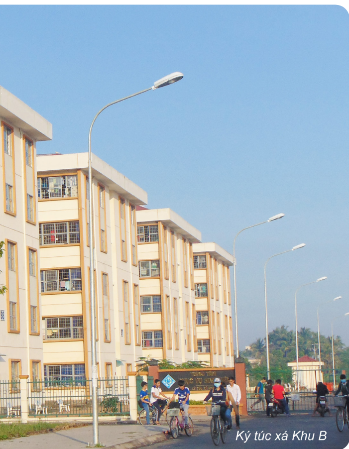
Ký túc xá Khu B

hỗ trợ giám sát tại các dãy nhà (phổ biến các thông báo, nhắc nhở công tác vệ sinh, đề xuất các yêu cầu của SV cho Ban Quản lý KTX ...). Đội An ninh xung kích thực hiện vai trò tuyên truyền, nhắc nhở chấp hành nội quy; ghi nhận và đề xuất xử lý SV vi phạm; giữ gìn ANTT, hỗ trợ công tác phòng cháy chữa cháy, phát hiện người lạ mặt vào khu vực; huy động SV tham gia các hoạt động.... Đội SV nồng cốt (là thành viên Ban cán sự lớp, Ban chấp hành các Hội, Đoàn trong Trường, đảng viên là SV). Nhiệm vụ của nhóm này là nắm bắt dư luận xã hội, ghi nhận và báo cáo cho lãnh đạo Phòng Công tác Sinh viên và Trung tâm PVSV các trường hợp bất thường hoặc các hiện tượng có dấu hiệu bất thường để kịp thời xử lý (kể cả phát hiện SV có hoàn cảnh khó khăn cần giúp đỡ, các trường hợp SV bị trầm cảm,...).