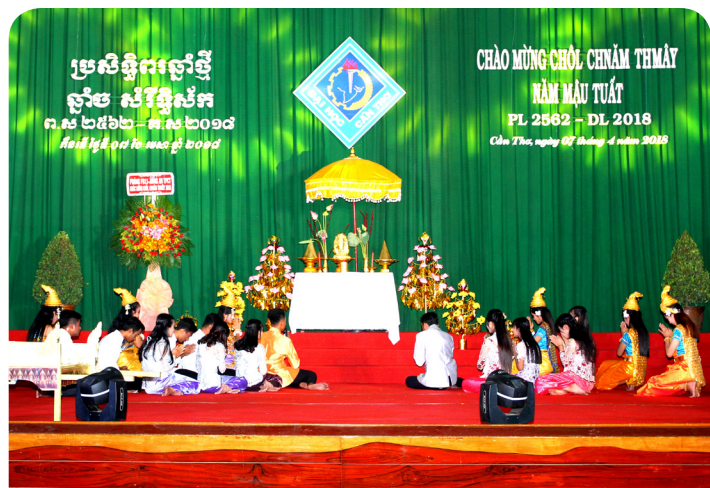
Tiết mục Kịch thể hiện truyền thống đón tết cổ truyền Chôl Chnăm Thmây của Dân tộc Khmer.

Mở đầu đêm giao lưu, đại biểu và các em sinh viên đã cùng nhau ôn lại nguồn gốc và ý nghĩa của Tết cổ truyền Chôl Chnăm Thmây thông qua tiết mục kịch mở màn thật đặc sắc. Đây là một tiết mục thể hiện truyền thống đón Tết cổ truyền Chôl Chnăm Thmây của dân tộc Khmer trong ngày đầu tiên của 03 ngày Tết, do sinh viên Khmer Trường ĐHCT biểu diễn.