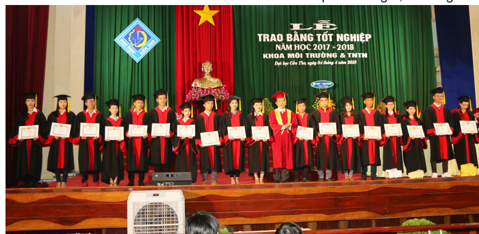
Sinh viên xuất sắc nhận khen thưởng.

Cuối năm 2017, Đoàn đánh giá ngoài của Trung tâm Kiểm định Chất lượng Giáo dục, Đại học Quốc gia Thành phố Hồ Chí Minh đã tiến hành đánh giá chất lượng cấp cơ sở giáo dục theo tiêu chuẩn kiểm định chất lượng của Bộ Giáo dục và Đào tạo tại Trường ĐHCT, theo kết quả đánh giá, Trường ĐHCT đã đạt yêu cầu về