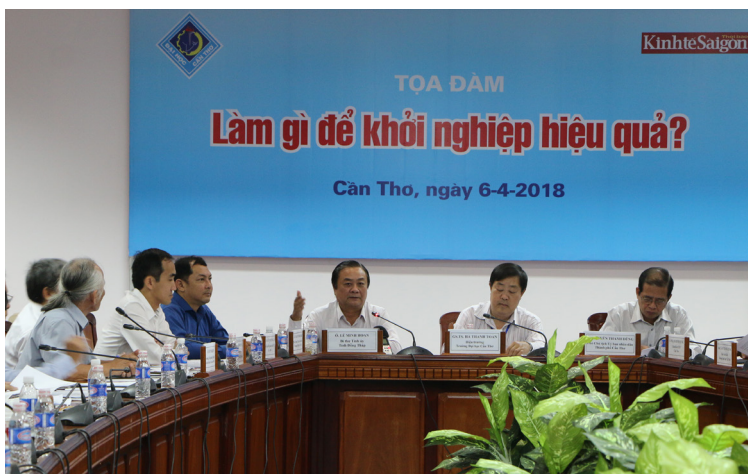
Tọa đàm “Làm gì để khởi nghiệp hiệu quả?” diễn ra tại Nhà điều hành, Trường ĐHCT.