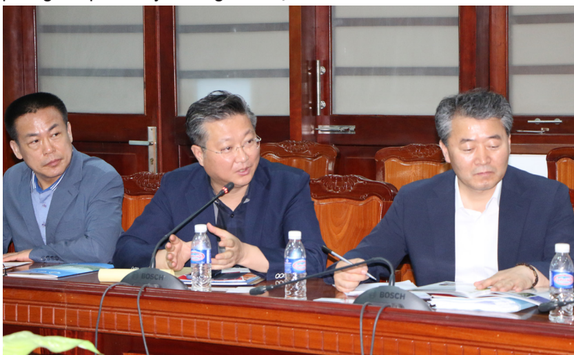
Thảo luận tại buổi làm việc.

sở những thông tin được chia sẻ của hai trường cùng với mong muốn xây dựng mối quan hệ tốt đẹp, hai bên đã cùng thảo luận và đưa ra định hướng cho những hoạt động hợp tác sắp tới. Trước hết, một biên bản ghi nhớ sẽ được ký kết làm cơ sở xúc tiến những hoạt động hợp tác cụ thể nhằm mục tiêu mang lại lợi ích chung và phát huy những thế mạnh của hai bên.